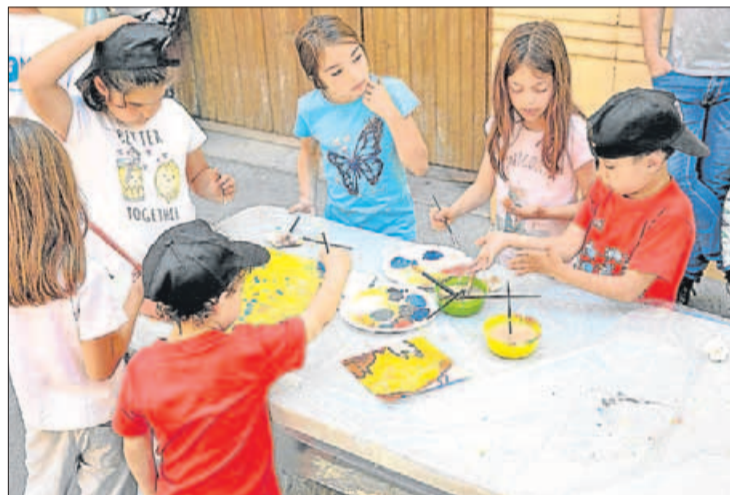
Taller de creativitat plàstica.

De matí, els més menuts es van reivindicar com a protagonistes del