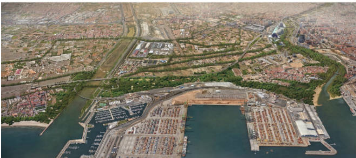
Futur escenari amb la recuperació de La Punta.