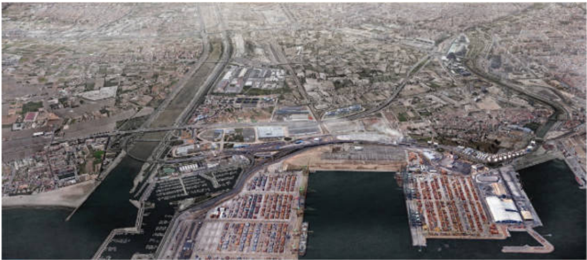
Futur escenari amb la construcció de la ZAL.

Després d'introduir els canvis pertinents per a poder dur endavant la ZAL, d'acord amb la normativa de la Unió Europea, el procés ha reviscolat. La nova proposta inclou mesures paisatgístiques per a reduir l'impacte de l'anterior projecte, com ara una façana d'arbres entorn la zona portuària. El govern de la Nau considera ara inviable revertir el procés , al qual s'oposava, per a recuperar eixa part de l'horta sud a causa de l'elevat cost que implicaria la reversió.