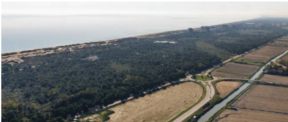
Exemple de desurbanització per a protegir el paisatge, La Devesa del Saler.

http://valenciaplaza.com/la-punta-per-al-poble